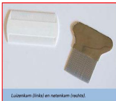
Luizenkam (links) en netenkam (rechts).

Luizen kunnen niet zwemmen of overleven in chloorwater, een besmetting kan dus niet in het zwembad overgebracht worden. Chloor water kan wel een negatieve werking hebben op de werkzame stof in een anti luizen middel